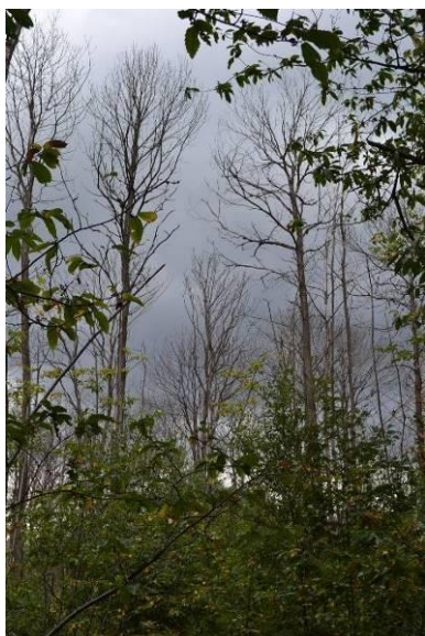
Image de châtaigniers atteints de la maladie de l'encre

Il n'y a pas de traitement pour lutter contre cette maladie.